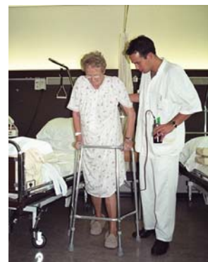
De eerste stappen na de heupoperatie.

Van hen zult u steeds minder hulp nodig hebben bij de lichamelijke verzorging of toiletgang.