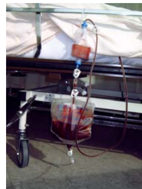
drain met bloedteruggavesysteem

De drain wordt de volgende dag verwijderd.