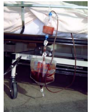
drain met bloedteruggavesysteem

De drain wordt de volgende dag verwijderd.